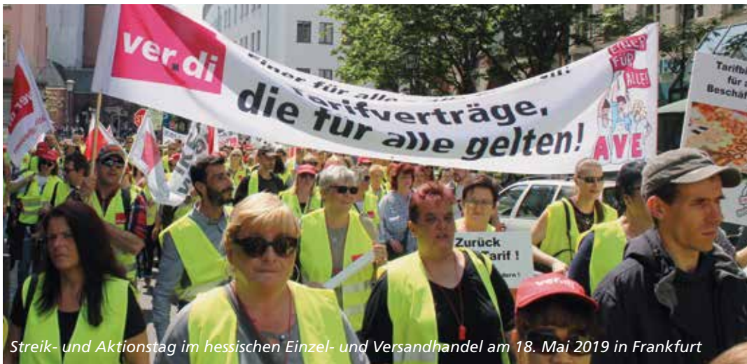
Streik- und Aktionstag im hessischen Einzel- und Versandhandel am 18. Mai 2019 in Frankfurt

Insbesondere der verhältnismäßig hohe Anstieg der Ausbildungsvergütungen wird Ausbildungsplätze im Einzel- und Versandhandel attraktiver machen.