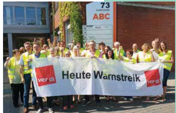
Streiks im Groß- und Außenhandel bei Alliance Health Care im Vertrieb in Frankfurt am 17. Juni (links), beim Rewe-Lager in Neu-Isenburg am 19. Juni (Mitte) und bei Alliance Health Care in der Zentrale in Frankfurt am 26. Juni 2019 (rechts).

Die Frage der Allgemeinverbindlicherklärung der Tarifverträge war in allen Verhandlungsrunden ein Diskussions- und Streitpunkt. Doch lehnten die Arbeitgeber hier ein gemeinsames Vorgehen mit ver.di beim Hessischen Sozialministerium rundweg ab. Trotzdem war, ist und bleibt diese Forderung eine wichtige Aufgabe und Herausforderung künftiger Tarifpolitik im Groß- und Außenhandel/Verlage.