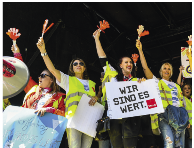
Kolleginnen aus dem Einzelhandel bei einer Tariffkundgebung in München

Doch auch dort, wo es um gleiche Tätigkeiten im gleichen Beruf geht, verdienen Frauen oft weniger als Männer. Besonders krass ist die Situation im Handel. Einer Erhebung zufolge lagen die Gehälter von Frauen im Lebensmittel-Einzelhandel um 12,17 Prozent unter denen ihrer Kollegen. In