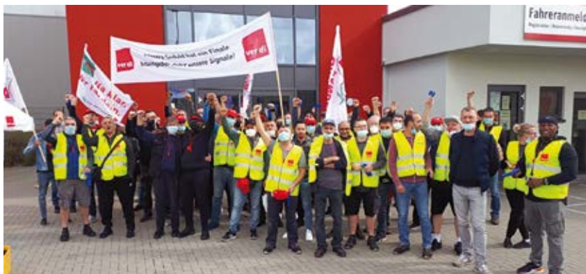
Für deutlich mehr Geld: Streik beim Rewe Logistik Zentrum, Neu Isenburg am 30. September 2021.

Doch mehr war nicht drin: Nicht nur, weil die Arbeitgeber sich einer größeren Gehalts- und Lohnerhöhung grundsätzlich verweigerten, sondern diese eigentlich bereits 2021 deutlich unter 2 Prozent und spürbar unter der Preissteigerung halten wollten. Wer in den Betrieben und in der Öffentlichkeit bei