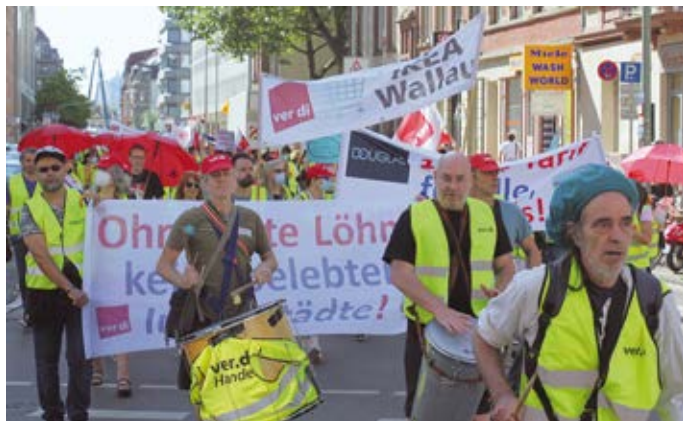
Streik- und Aktionstag im hessischen Einzel- und Versandhandel am 7. Juli 2021 in Frankfurt.

Demgegenüber hatte ver.di immer wieder betont, dass deutliche Preissteigerungen sowohl 2021 als auch in diesem Jahr zu erwarten und von den Beschäftigten zu „stemmen“ sein werden. Insofern sind die 1,7 Prozent mehr Geld ab 1. April 2022 mehr als nichts, aber sie reichen nicht aus, um die „Lücke“ beim verfügbaren Nettoeinkommen zu schließen.