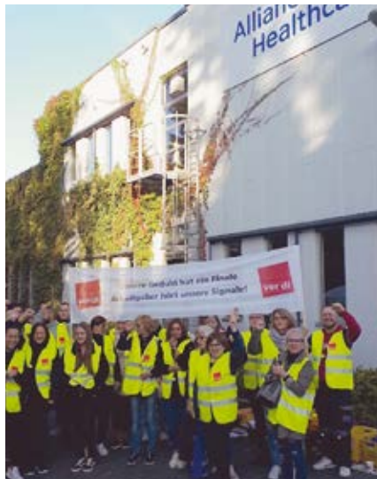
Für deutlich mehr Geld: Streik bei Rewe im Juli 2021 und bei Alliance Healthcare Frankfurt.

Wem das zu wenig ist, muss für die nächste Chance mehr tun: sich in ver.di organisieren, Mitglieder werben, Streiks vorbereiten und gemeinsam mit anderen kämpfen.